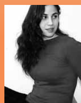
Ying Lai Green Kontrabass