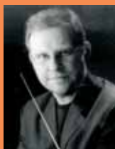
Carsten Zündorf Orgel